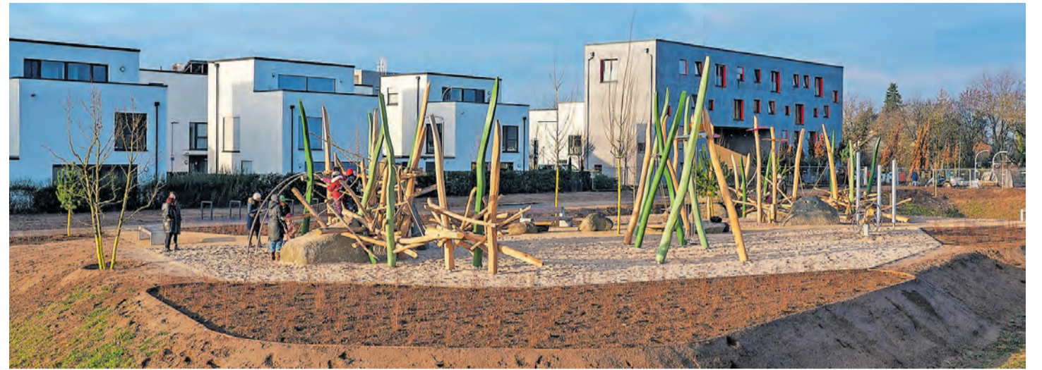
Blick auf den Spielplatz „Stadtdüne“

Beim Spielplatz „Teufelsberg“ am nördlichen George-Sullivan-Ring mit einer 12 Meter langen Hangrutsche laden unterschiedliche Kletter- und Hangmöglichkeiten, eine 3D-Kletterstruktur, zwei Schaukeln sowie eine Nestschaukel vorrangig Kinder zwischen 6 und 12 Jahren zum Spielen ein. Für Kleinkinder steht ein kleiner Sandbereich zur Verfügung. Die Spielgeräte aus Stahlrohrkonstruktionen sind so konzipiert, dass Balance und Körpergefühl für alle Altersgruppen angesprochen werden. In unmittelbarer Nachbarschaft an der Grenze zur Wohnbebauung FRANKLIN-Mitte befindet sich zwischen zwei tiefer liegenden Überflutungsflächen der Spielplatz „Stadtdüne“ für Kinder zwischen 3 und 9 Jahren. Ausgestattet ist er mit einem Kleinkind-Sandfeld inklusive Klettermöglichkeiten und Rutsche. Für die größeren Kinder gibt es eine hohe Doppelschaukel, eine Nestschaukel sowie eine Wippe. Auf großen