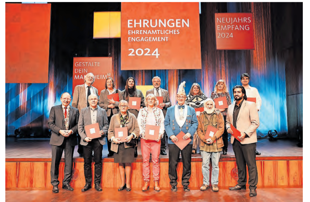
Ehrungen des ehrenamtlichen Engagements

Die Stadt Mannheim dankt der MVV Energie AG, der m:con – mannheim:congress GmbH, der GBG – Mannheimer Wohnungsbau-Gesellschaft mbH, der Stadtmarketing Mannheim GmbH, der Rhein-Neckar-Verkehr GmbH, der RNF GmbH, der Privatbrauerei Eichbaum GmbH & Co. KG und Coca-Cola European Partners Deutschland GmbH für die Unterstützung des Neujahrsempfangs. Eichbaum stellt den Erlös aus dem Verkauf seiner Produkte den ausgezeichneten ehrenamtlich Aktiven zur Verfügung.