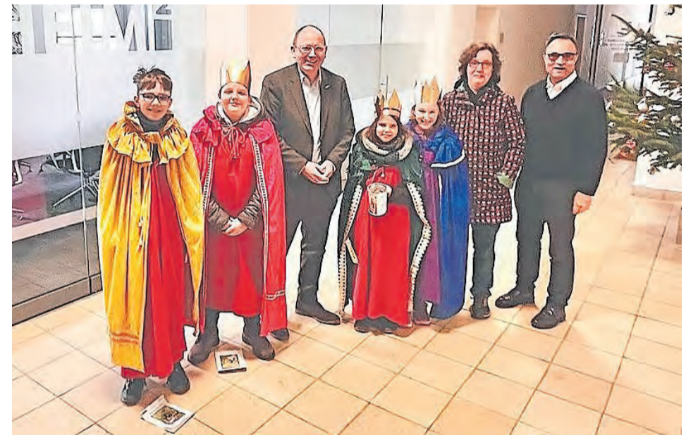
Besuch der Sternsinger im Rathaus 2024